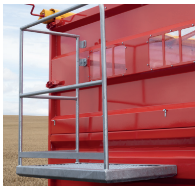
Galvaniseret og stabil platform