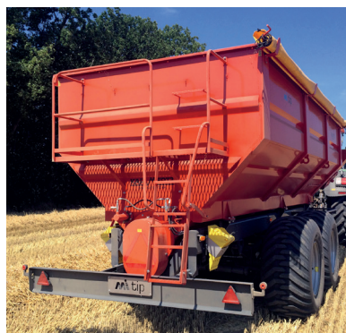
Platform og stige