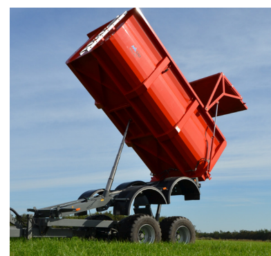
Konisk kasse og højtipp