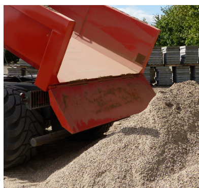
Hardox bund og sider