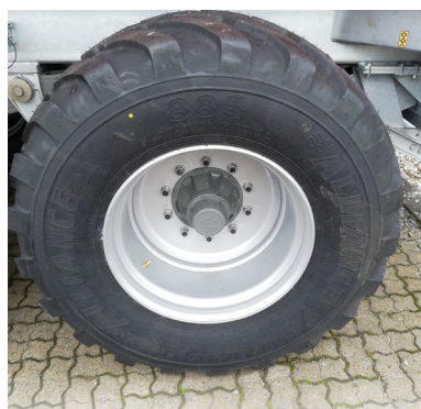
Der er 10 huls nav på alle SPC-vogne