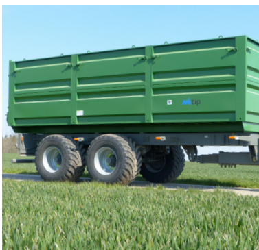
Mulighed for aftagelig sider