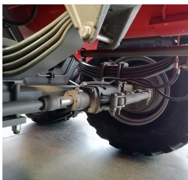
Selvstyrende bagerste aksel