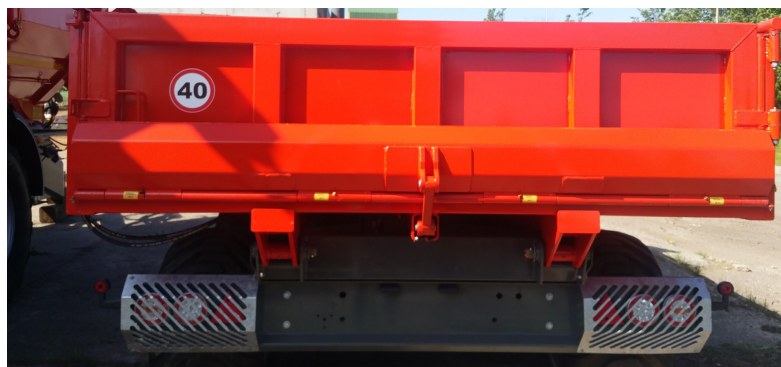
Hydraulisk nedklappelig bagsmæk. Aftagelig tophængt bagsmæk