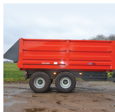
Tip direkte i kartoffellægger