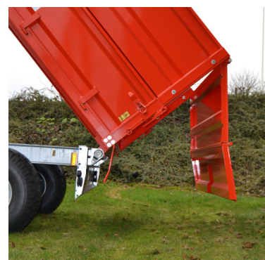
Aftagelige hjørnestolper og 2-delt bagsmæk