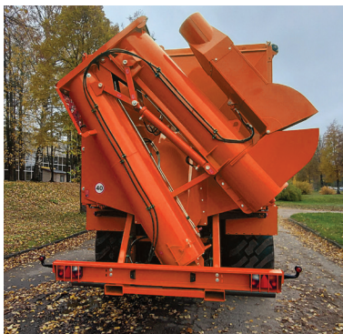
Snegl til omlæsning af korn