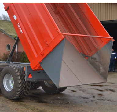
Højtipp med kartoffelbagende