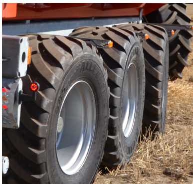
3 aksler med forreste og bagerste flydende/medløbende med låse