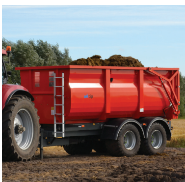
En vogn med mange muligheder