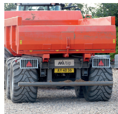
Mulighed for høj bagsmæk