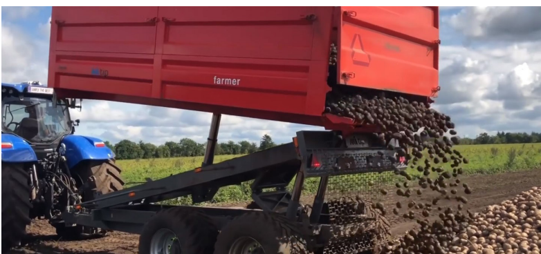
Højtipp op til 2.160 cm