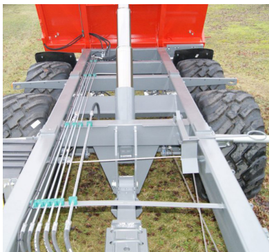
Stærk undervogn med affjedring