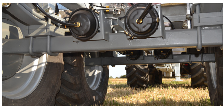
Stærk undervogn med TVZ- eller ADR-aksler.