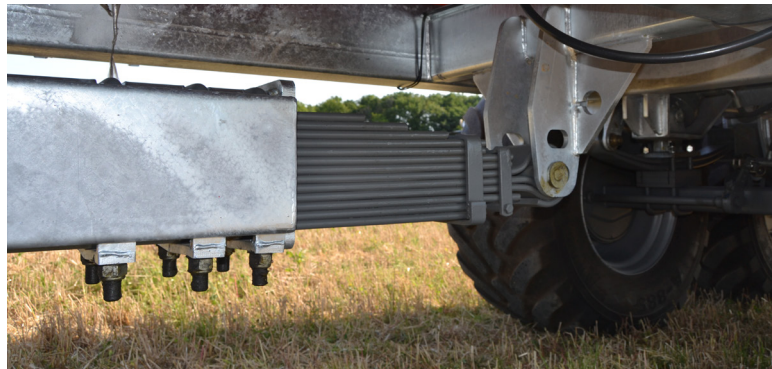
Justerbart og affjedret træk