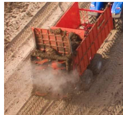
Spredning af staldgødning