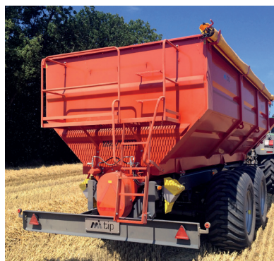
Plattform och stege