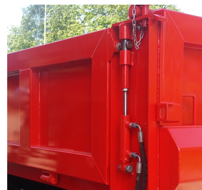
Hydrauliskt nedfällbar sida