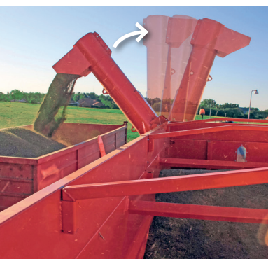
Förlängningsrör till vänster