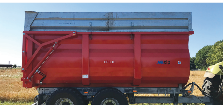
Man kan bygga på 60 cm