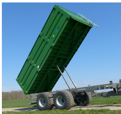
Tipping med tvådelad bakstam