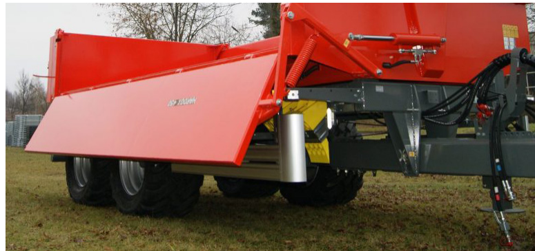
Hydrauliskt nedfällbar sida