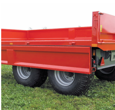
Alla fyra sidor kan fällas ner