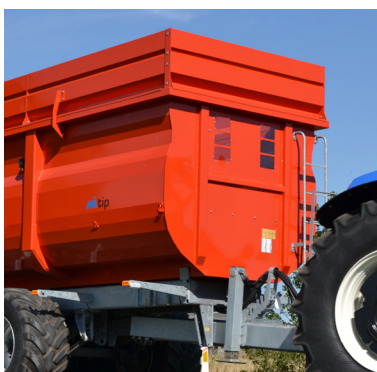
Bygg på 50 cm