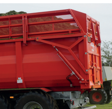
80 cm förhöjning för gräs